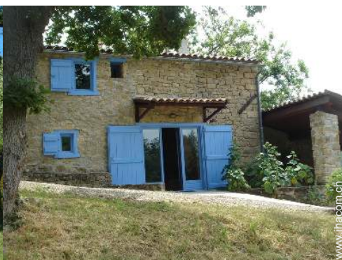
Außenausstattung zur Verfügung der Gäste