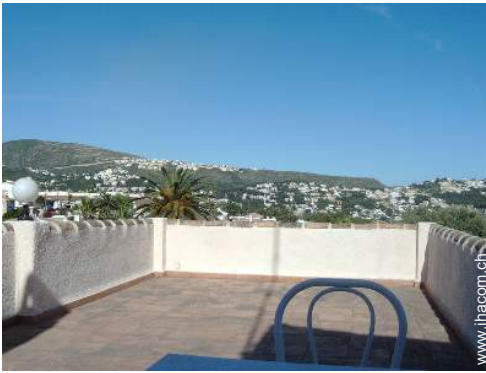
Blick auf Dächer