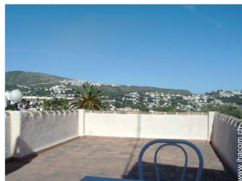
Blick auf Dächer