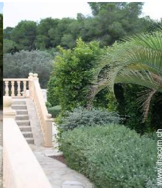
Empfang von Behinderten