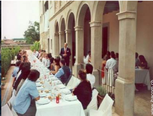
Blick aufs Land