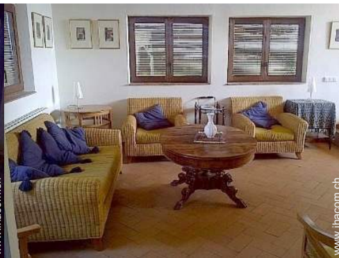
Raumaufteilung zur Verfügung der Gäste