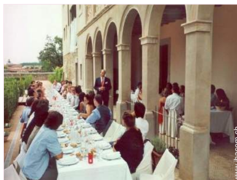
Blick aufs Land