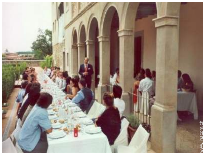
Blick aufs Land