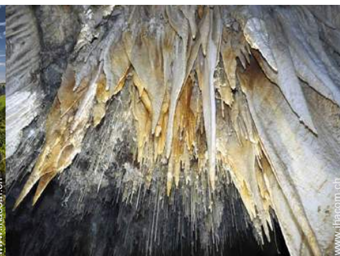
Flugsport in der Nähe