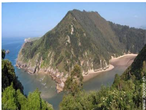
Sommeraktivitäten in der Nähe