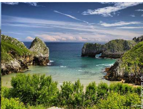
Sommeraktivitäten in der Nähe