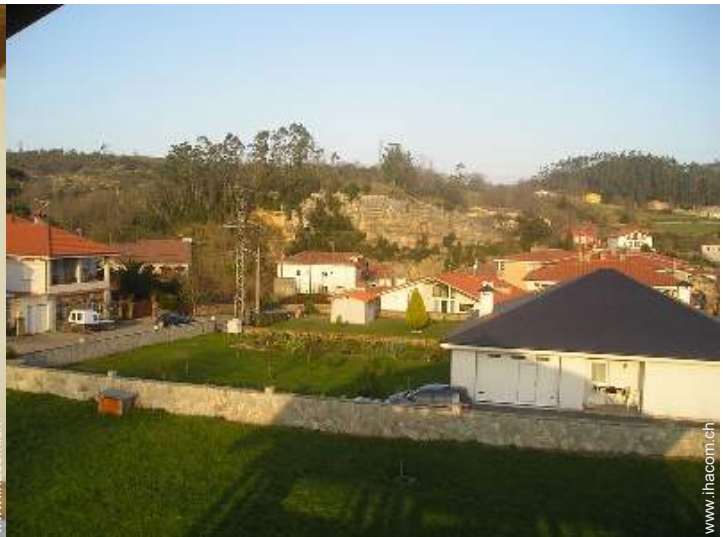
Blick auf Straße/Avenue