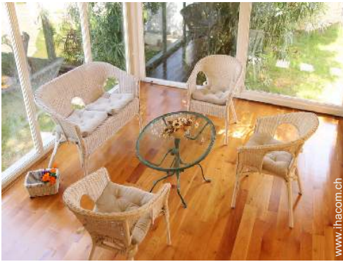
Innenkomfort zur Verfügung der Gäste