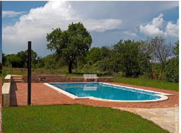
Blick auf Wiese