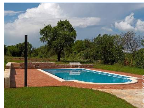
Blick auf Wiese