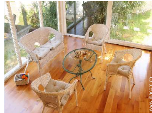
Innenkomfort zur Verfügung der Gäste

Außenküche, Freiluftsalon, Pizzeria, Grill, Gartentisch(e), 10 Gartenstuhl/-stühle, Sonnenschirm, Gartensalon, 10 Chaiselongue (s), Außendusche, Außentoilette