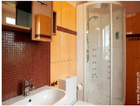
Innenkomfort zur Verfügung der Gäste