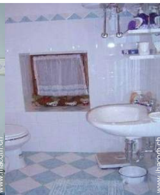
Raumaufteilung zur Verfügung der Gäste