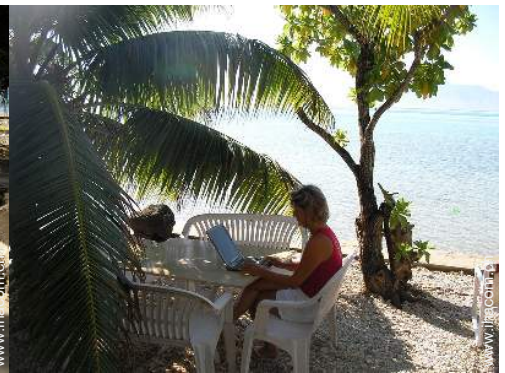
Wi-Fi (drahtloser Internetzugang)