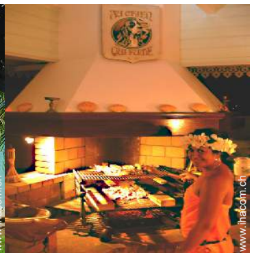
Table d'Hôte (Gemeinschaftstafel)