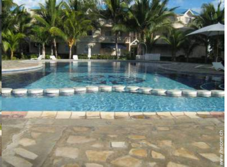
Swimmingpool in Wohnanlage