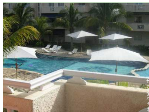
Swimmingpool in Wohnanlage