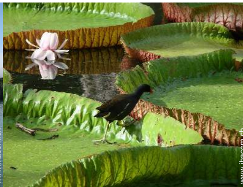
Gebirgsaktivitäten in der Nähe