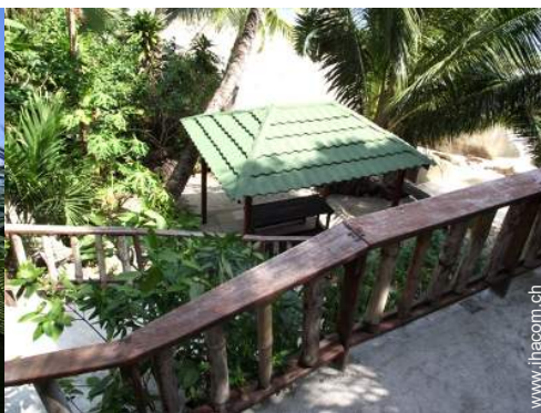
Außenausstattung zur Verfügung der Gäste