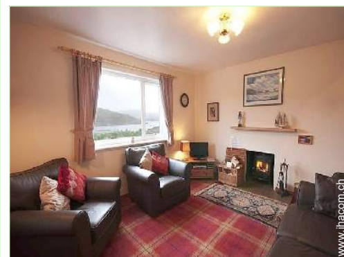
Innenkomfort zur Verfügung der Gäste