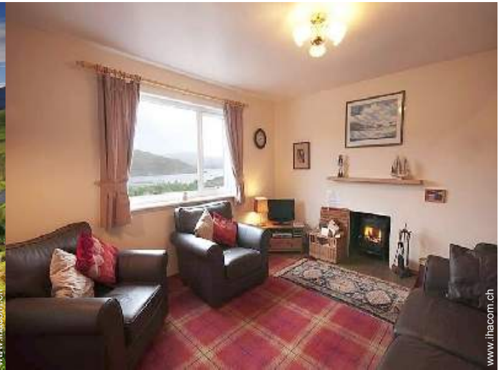
Innenkomfort zur Verfügung der Gäste