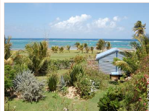
Bungalow mit Charme