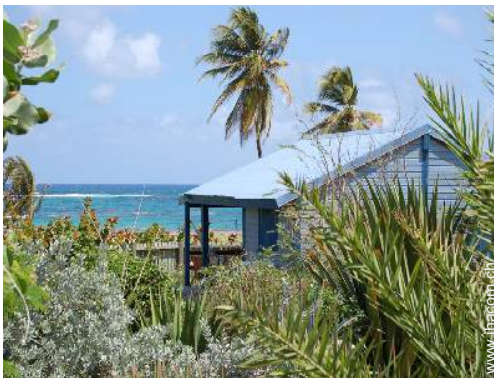
Bungalow mit Charme