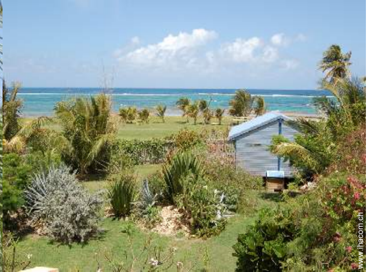
Bungalow mit Charme