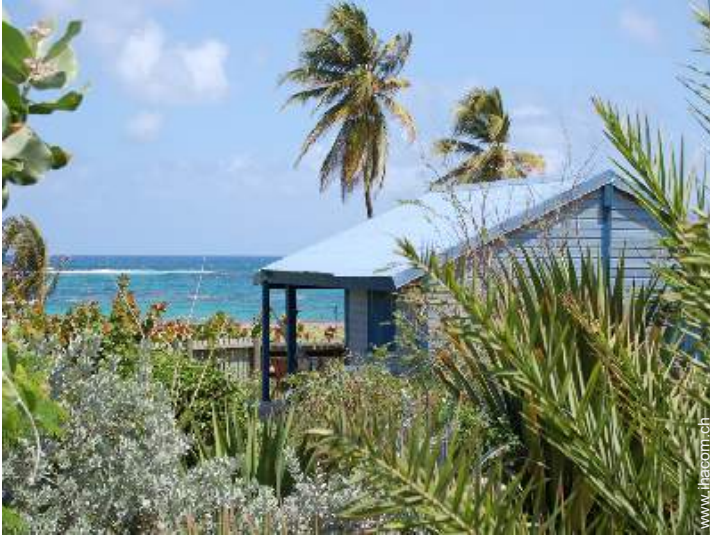
Bungalow mit Charme