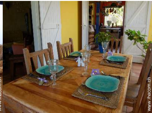
Table d'Hôte (Gemeinschaftstafel)