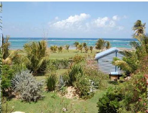
Bungalow mit Charme