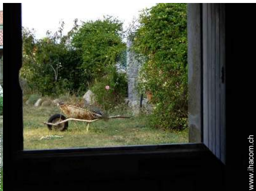
Blick aufs Land