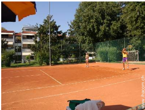
Tennis - Erde