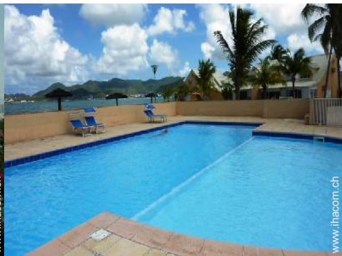
Blick auf Ozean