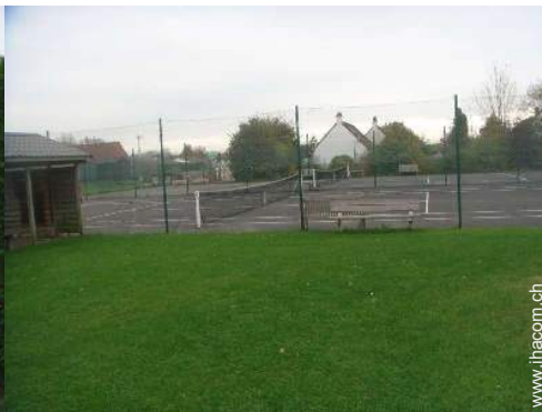
Tennisplatz - harter Belag