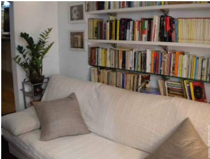
Sofabett(en) 1 Person