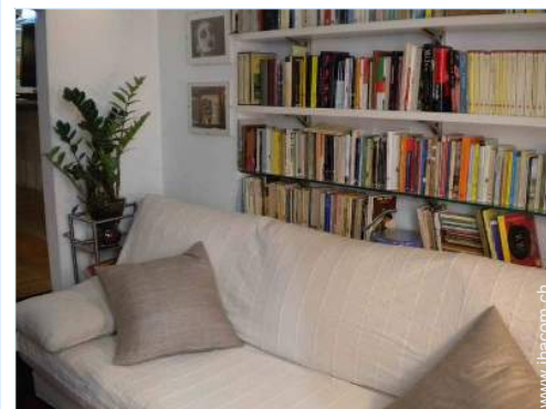
Sofabett(en) 1 Person

- Stadtzentrum 500m - Bushaltestelle <50m - Bäckerei <50m - Ortliche Geschäfte <50m - Supermarkt 200m - Luxus-/Markenboutiquen 200m - Friseursalon <50m - Internetcafé 200m - Post 300m - Bank <50m - Apotheke <50m - Arzt 500m - Krankenhaus 2km