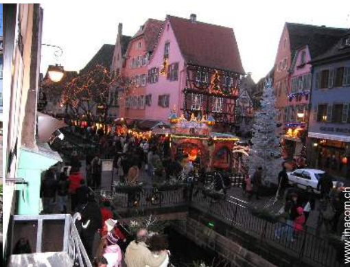
Blick auf Platz