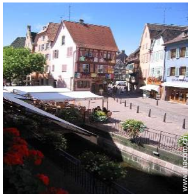
Blick auf Fußgängerzone