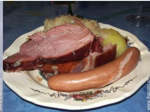
Table d'Hôte (Gemeinschaftstafel)