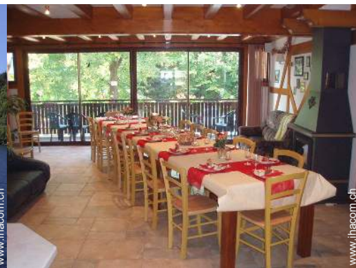
Table d'Hôte (Gemeinschaftstafel)