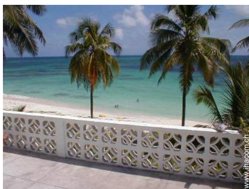
Blick auf Ozean