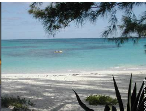
Wassersport in der Nähe