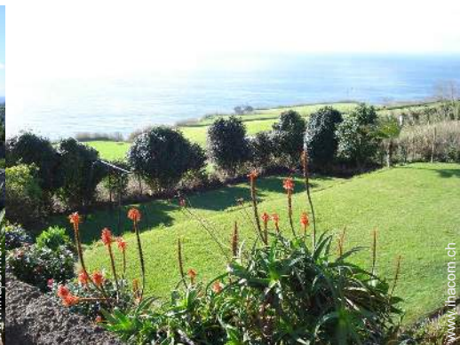
Blick auf Felder