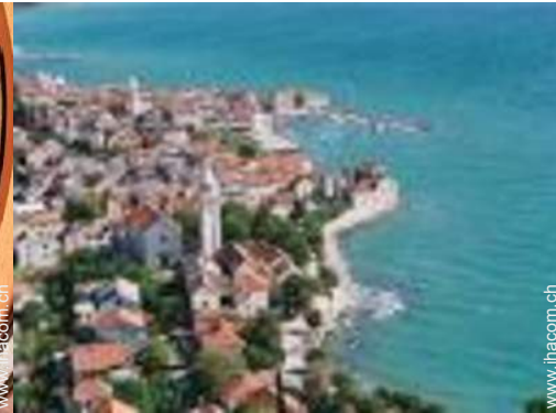
Nahe gelegene Städte