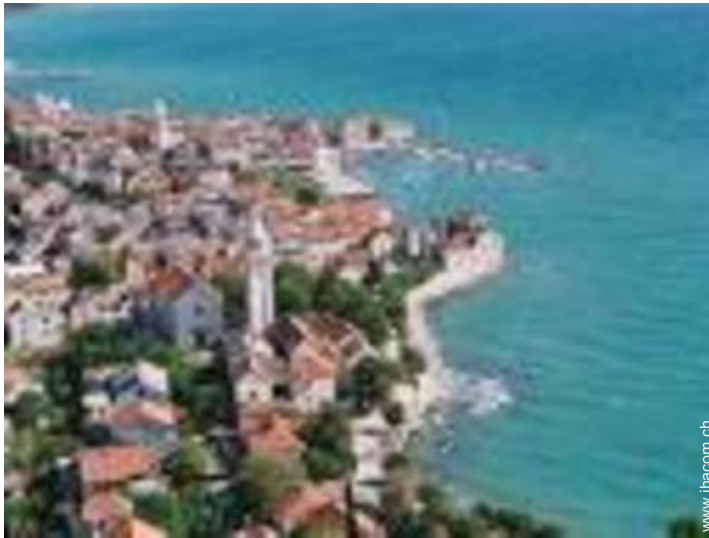
Nahe gelegene Städte