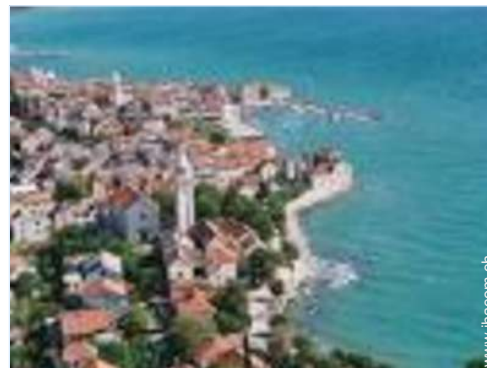
Nahe gelegene Städte