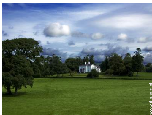
Blick auf Wiese