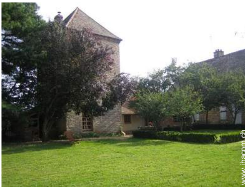
Haus mit Charme