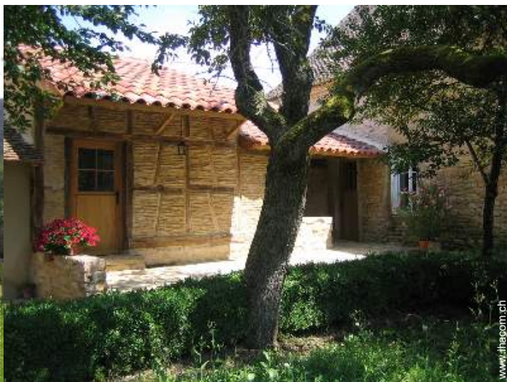
Haus mit Charme