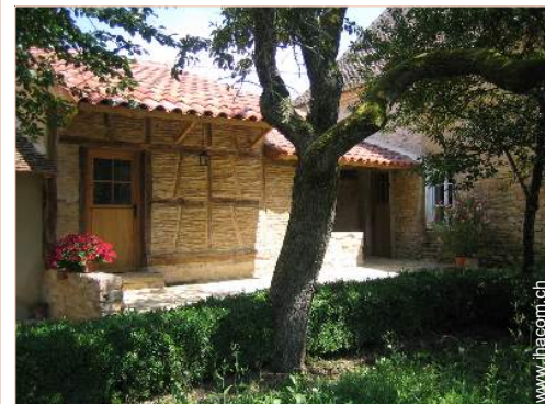
Haus mit Charme