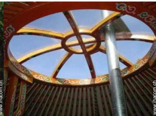
Jurte mit Charme (mongolisches Zelt)