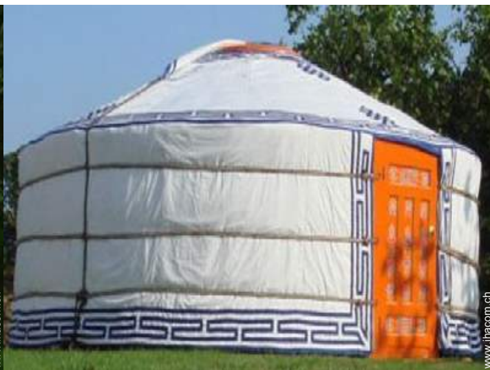
Jurte mit Charme (mongolisches Zelt)