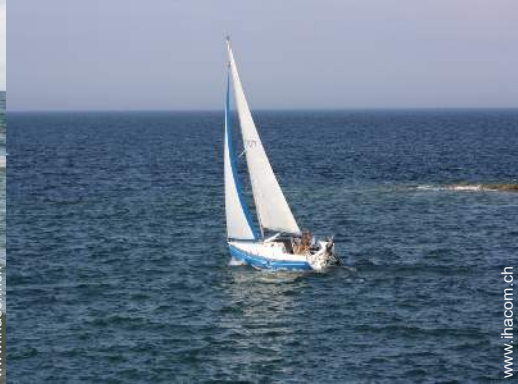
Blick auf Ozean