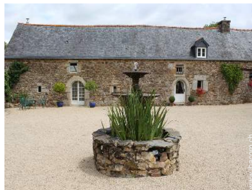
Steingebäude mit Charme