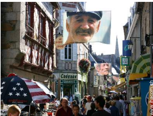
Sommeraktivitäten in der Nähe