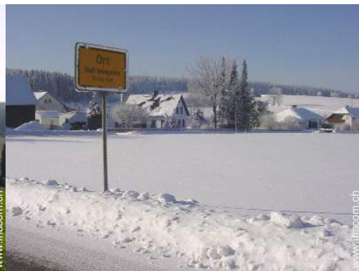
Winteraktivitäten in der Nähe