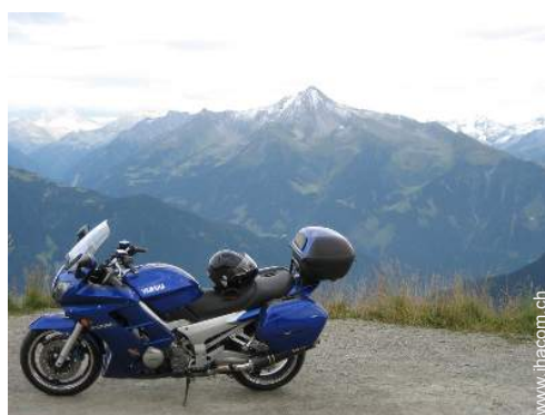
Motorsport in der Nähe