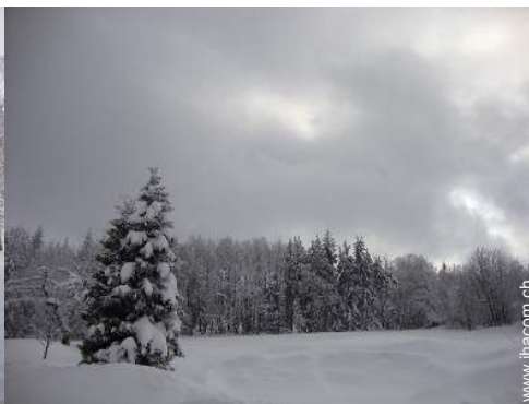
Blick auf Wald