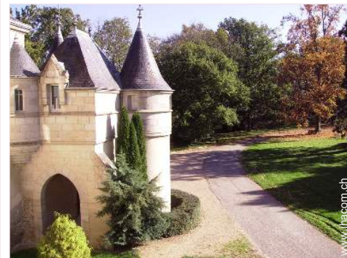
Schloss - Burg

- Dorfzentrum 1km - Bushaltestelle - Fahrrad-/Mountainbikeverleih - Autovermietung - Wäscherei/Wäscheverleih - Bäckerei - Feinkosthändler - Ortliche Geschäfte - Supermarkt - Friseursalon - Post - Bank - Geldautomat - Apotheke - Arzt - Krankenschwester - Krankenhaus 10km