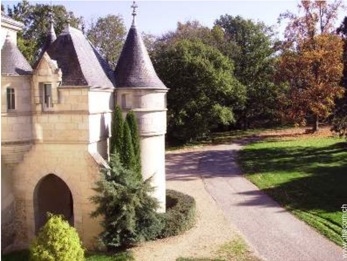
Schloss - Burg