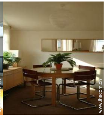
Cottage mit Charme