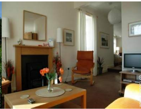
Cottage mit Charme