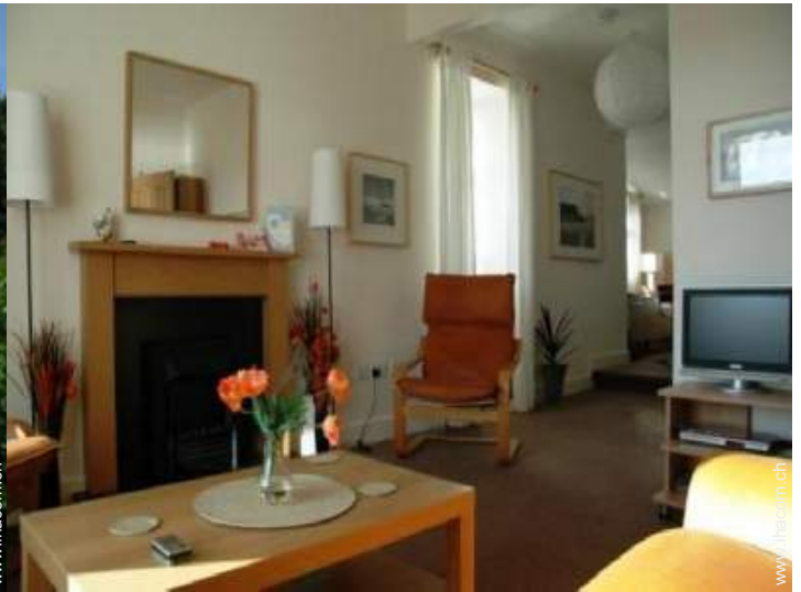
Cottage mit Charme