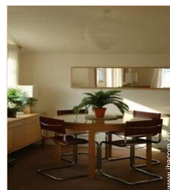
Cottage mit Charme