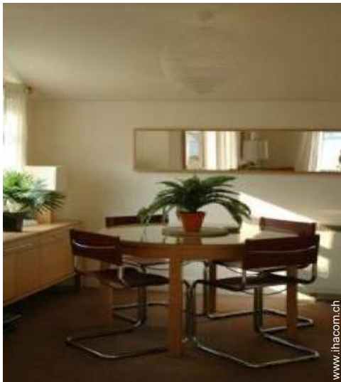
Cottage mit Charme