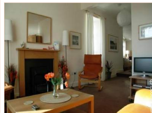
Cottage mit Charme