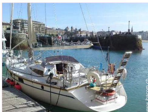
Blick auf Hafen