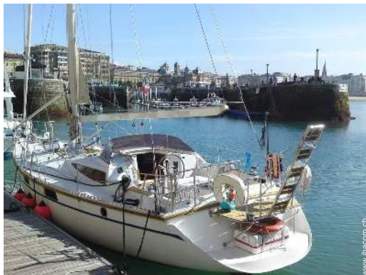
Blick auf Hafen