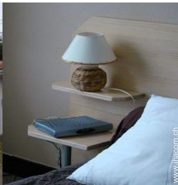
Wi-Fi (drahtloser Internetzugang)