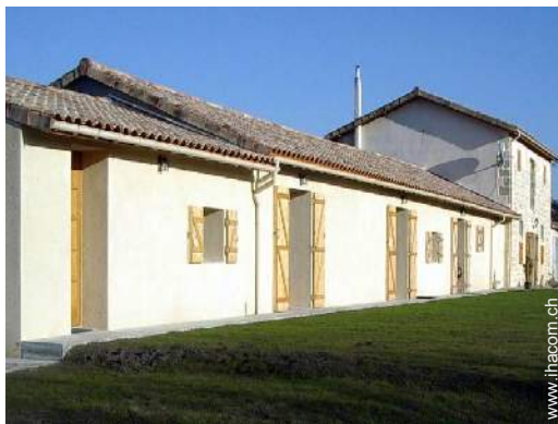
ehem. Scheune mit Charme