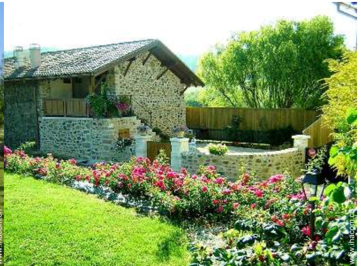
Haus mit Charme