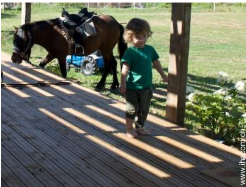
Pferde und Reitausrüstung