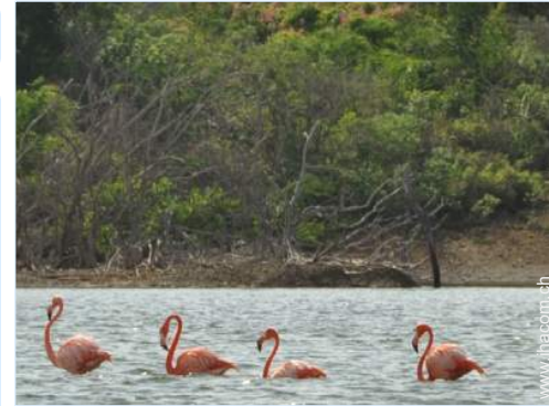
In der Nähe