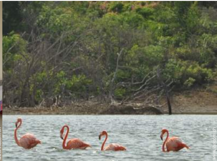
In der Nähe