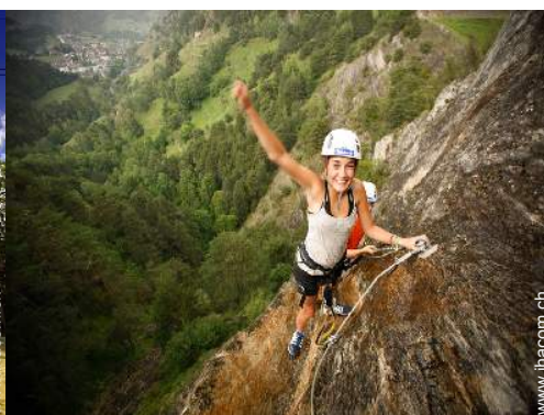
Via ferrata (Klettersteig)