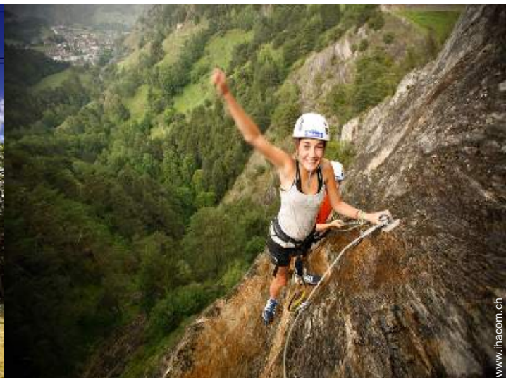
Via ferrata (Klettersteig)