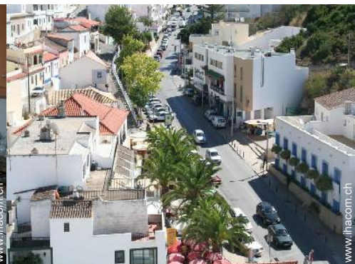
Blick auf Dächer