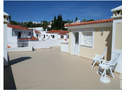
Blick auf Dächer