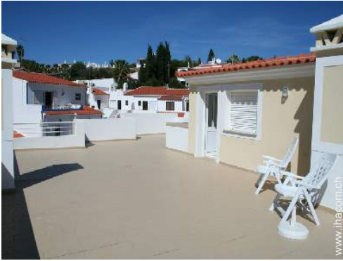
Blick auf Dächer