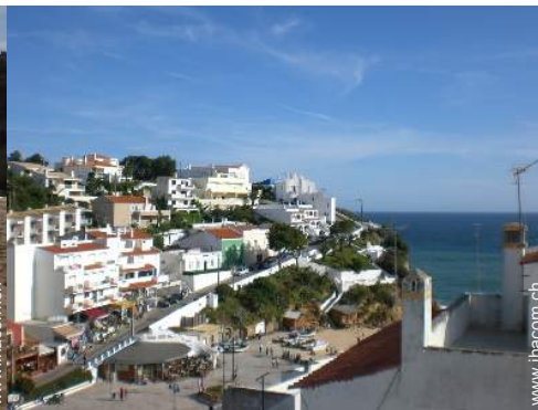
Blick auf Platz