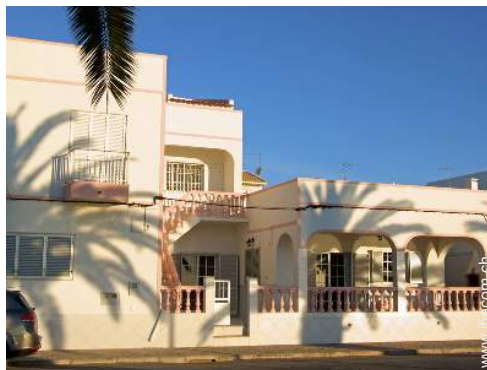
Anwesen mit Charme