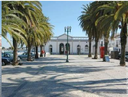
Blick auf Stadtzentrum