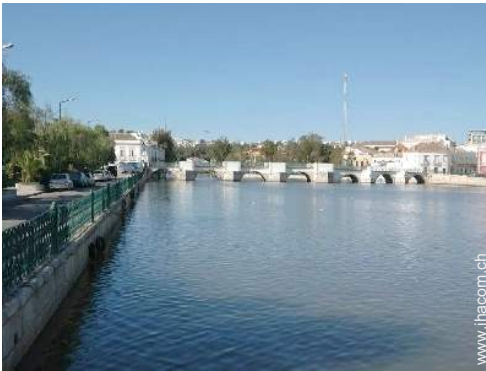
Blick auf Stadtzentrum