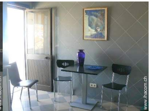
große separate Küche