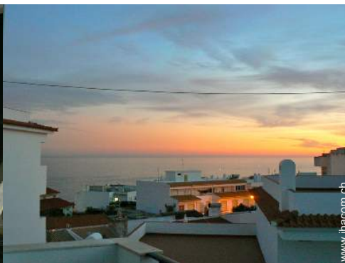
Blick auf Dächer