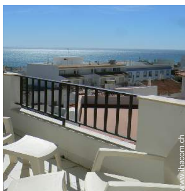
Blick auf Ozean