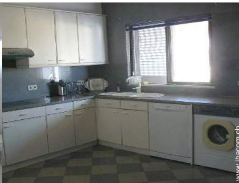
große separate Küche