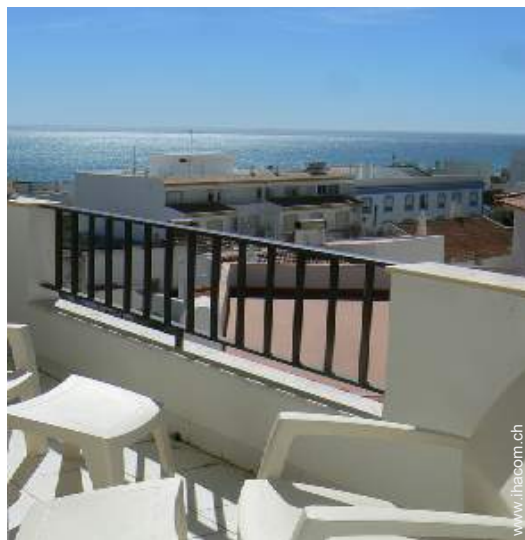
Blick auf Ozean