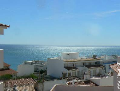
Blick auf Dächer