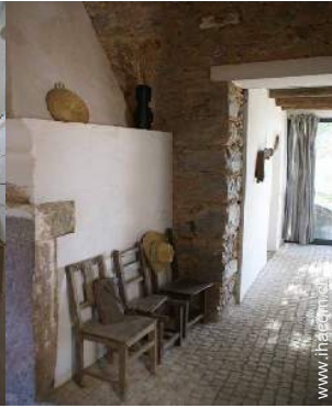
ehem. Bauernhof mit Charme