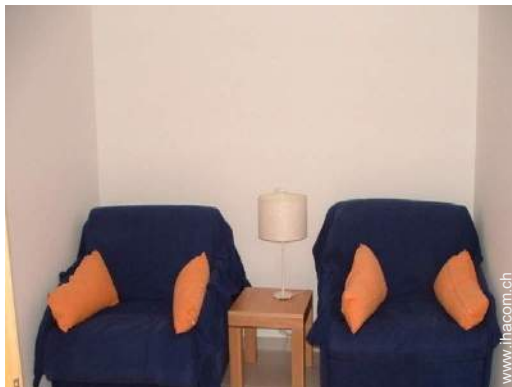
Schrankbett(en) 2 Personen