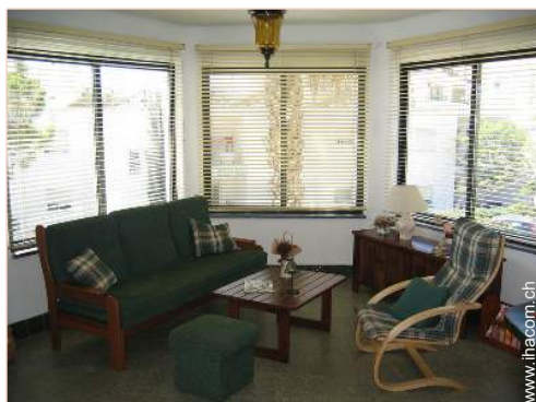
Apartment mit Charme