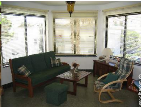
Apartment mit Charme