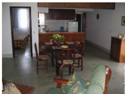
Apartment mit Charme