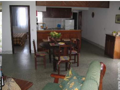
Apartment mit Charme