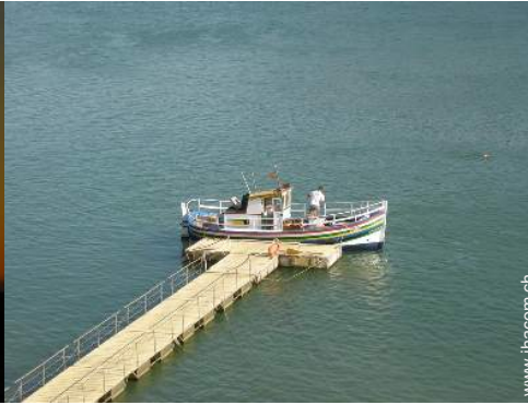
Flugsport in der Nähe