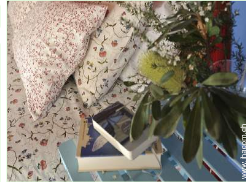
Innenkomfort zur Verfügung der Gäste