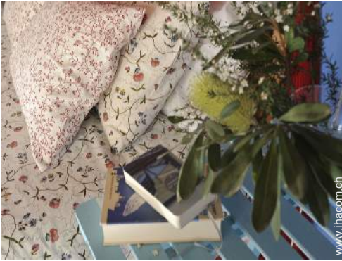
Innenkomfort zur Verfügung der Gäste